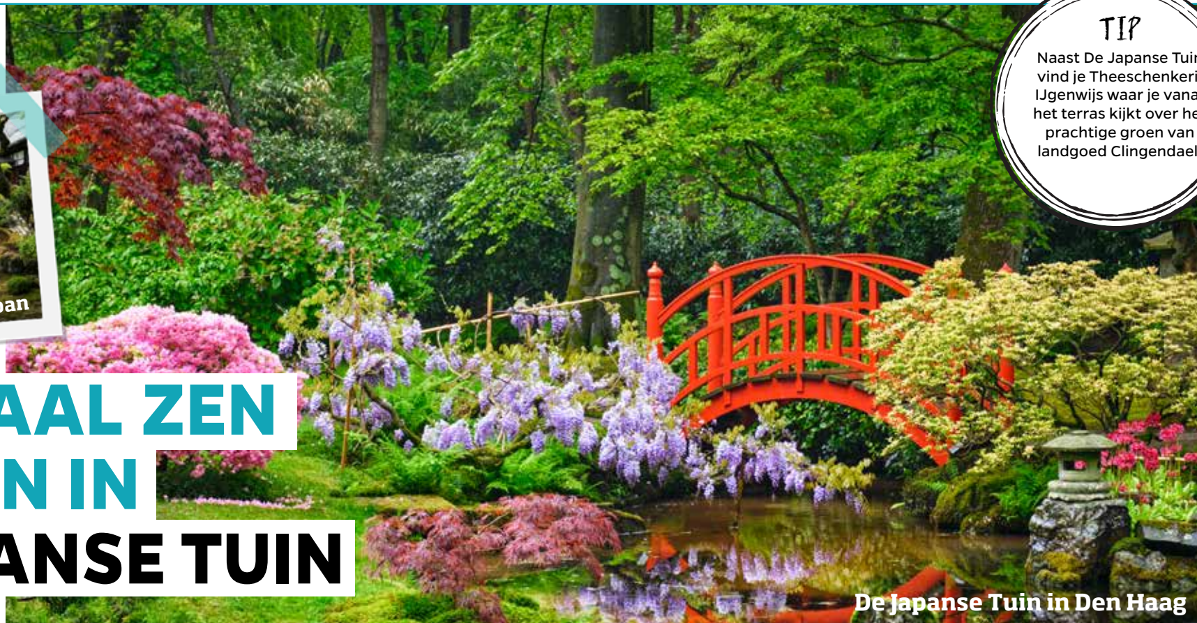
De Japanse Tuin in Den Haag

Japanse tuinen stralen serene rust uit en zijn van oudsher bedoeld als plek voor wandelingen en bezinning. Gelukkig hoef je niet helemaal naar Japan om de rust van een Japanse tuin te ervaren. In Den Haag bevindt zich De Japanse Tuin, het pronkstuk van landgoed Clingendael. De tuin is tot in perfectie aangelegd en er zijn prachtige en zeldzame bomen en planten te zien.