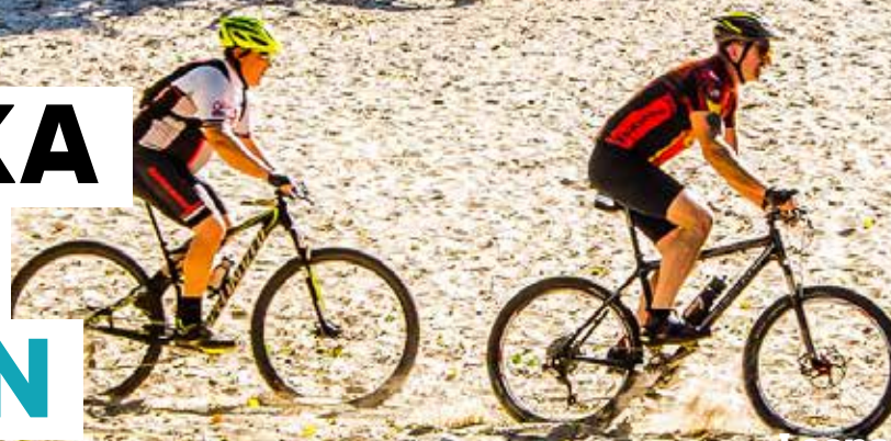
Loonse en Drunense Duinen